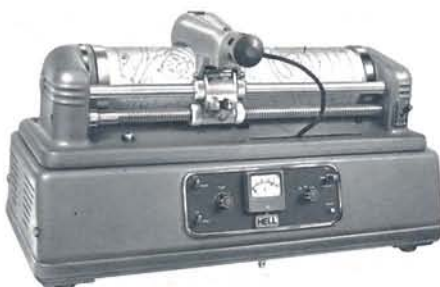
Hellfax Wetterkartensender WF 104