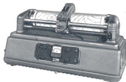
Hellfax Wetterkartenempfänger WF 103