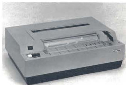
Moderne Hellfaxtechnik Fernkopiergerät HF 1048 für Bürobetrieb